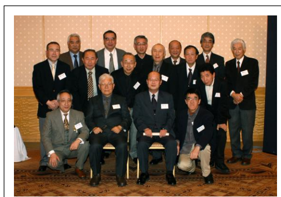
電気 B 組