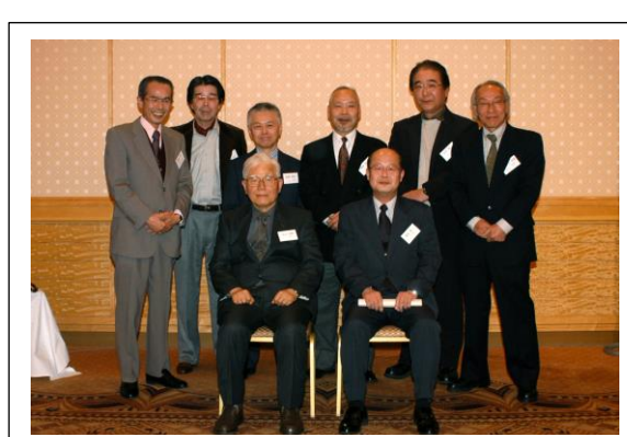
印刷 B 組