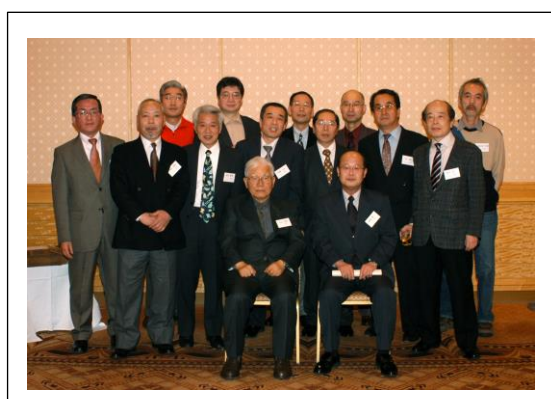
印刷 A 組