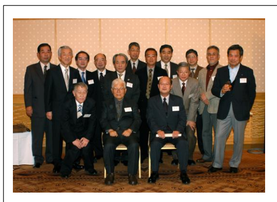
電気 A 組